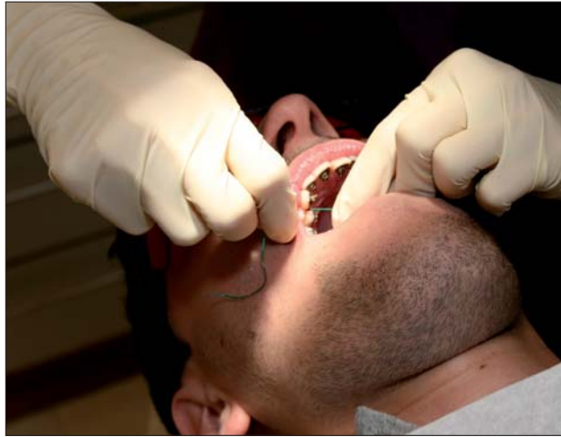
Live-Demonstrationen am Patienten.