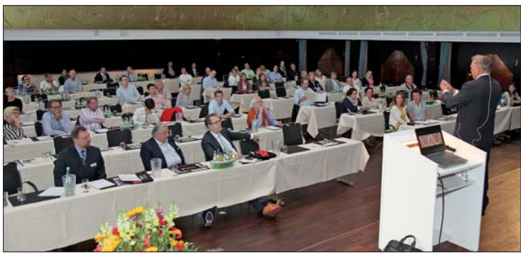
Vom 13. bis 14. Juni 2014 lud die GC Orthodontics Europe GmbH zu ihrer ersten Fortbildung „EXPERTS on Stage“ in den Norden Deutschlands.

GC Orthodontics: erstes Fortbildungsevent, erstes Highlight.