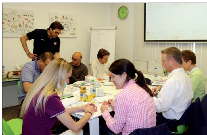
Praktische Übungen am Typodonten.

Zum morgendlichen Beginn des eintägigen Kurses wurden zunächst klinische Behandlungsfälle mit dem verwendeten Incognito™ Appliance System im Seminarraum der Baden-Badener Gemeinschaftspraxis präsentiert.