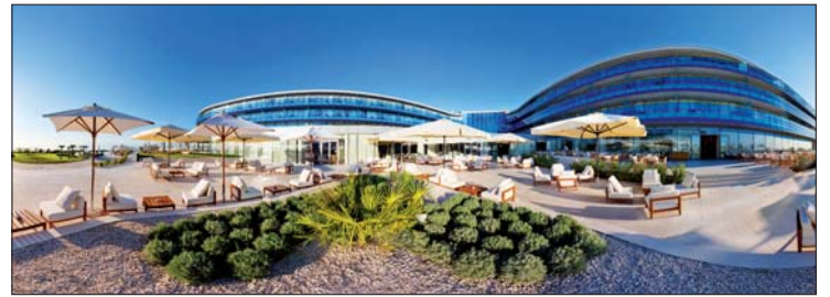
Veranstaltungsort des VII. FORESTADENT Symposiums ist das Falkensteiner 5-Sterne-Luxushotel & Spa Iadera auf der kroatischen Halbinsel Punta Skala.