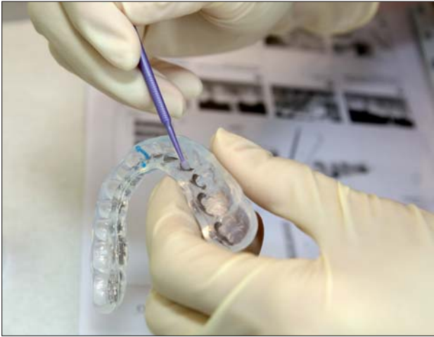
Clear Precision Tray der Firma 3M Unitek – die Vorbereitung des Klebtrays.