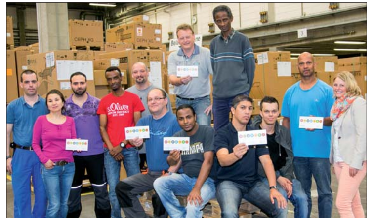
Geliebte Diversity bei Sirona: Am Standort Bensheim arbeiten Mitarbeiter aus 35 Nationen zusammen.

Unter dem Motto „Vielfalt unternehmen!“ beging Deutschland Anfang Juni den zweiten Diversity-Tag. Sirona beteiligte sich mit einer Ausstellung und einer Fotoaktion an den bundesweit rund 550 Aktionen, um auf die Bedeutung von Vielfalt in der Arbeitswelt aufmerksam zu machen.