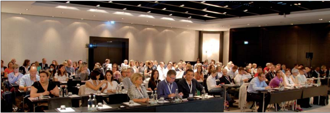
Rund 150 Anwender des BENEFIT®-Systems fanden sich im Hyatt Regency im Düsseldorfer Medienhafen zum alljährlichen Erfahrungsaustausch ein.