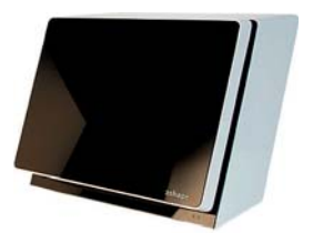
R700 3D Desktop Scanner Modelle & Abdrücke