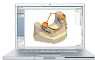
ApplianceDesigner™ Design Software für nahezu alle Appliances