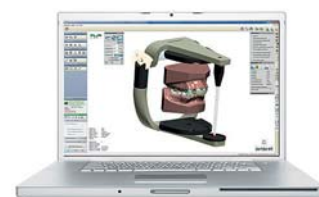
OrthoAnalyzer™ Analyse Software, virtuelle Behandlungsplanung

Als Pionier und Spezialist im Bereich der digitalen Anwendungen stehen wir Ihnen als starker Partner zur Seite. www.dimension-orthodontics.de