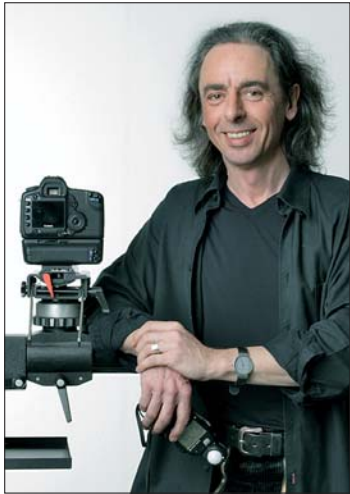
Optimal gelungene Patientenaufnahmen sind das A und O einer guten Falldokumentation. Fotograf Erhard J. Scherpf zeigt am 5. Dezember 2014 in Kassel, wie es geht.

FORESTADENT Kurs mit Erhard J. Scherpf vermittelt komplettes Wissen von A bis Z rund um die professionelle Dental fotografie.