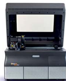
OrthoDesk Objet30 3D Printer für den Praxis- und Laborbereich

Ein Lösungsportfolio für die Kieferorthopädie von morgen.