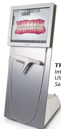
TRIOS® Ortho Intraoral Scanner Ultrafast Optical Sectioning™ Technologie