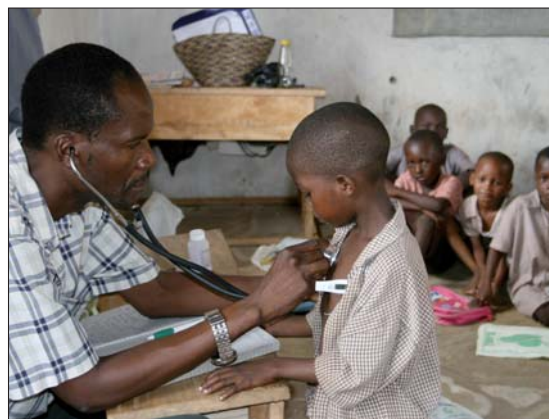
Mit dem Erlös der Aktion kann die medizinische Versorgung der Kinder in Kidzangoni für mehr als sieben Monate sichergestellt werden.

„Spatzi“, „Mausi“, „Bazi“ – eine ganz besondere Wohltätigkeitsaktion hatte sich DENTSPLY GAC für die diesjährige DGKFO-Jahrestagung in München ausgedacht: An seinem Messestand bot der Marktführer bei selbstligierenden Brackets die weltbekannten Oktoberfestherzen an – allerdings nicht aus Lebkuchen, sondern aus Filz. Mithilfe der bayerischen Kunstwerke verbessert sich die medizinische Versorgung eines afrikanischen Dorfes. Eine Spendenaktion mit den