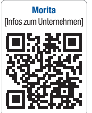
Morita (Infos zum Unternehmen)