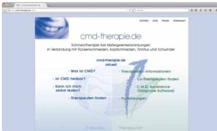
Neben umfassenden Informationen zum Krankheitsbild finden Patienten auf www.cmd-therapie.de den CMD-Therapeuten in ihrer Nähe.