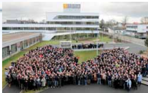
Am Standort von Sirona Dental Systems in Bensheim arbeiten rund 1.600 Mitarbeiter.

Sirona Dental Systems GmbH Fabrikstraße 31 64625 Bensheim Tel.: 06251 16-0 Fax: 06251 16-2591 contact@sirona.com www.sirona.com