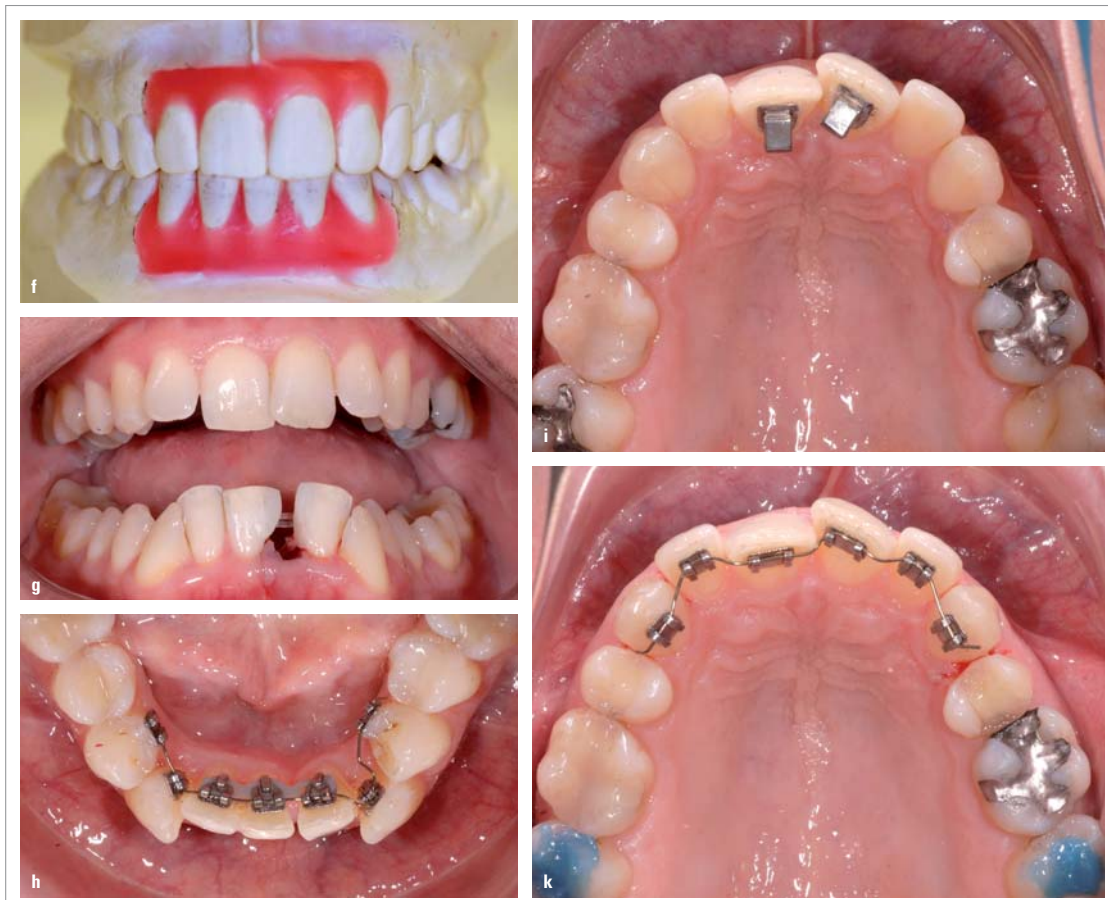
Abb. 3f-k: Set-up mit Inzisiven-Extraktion (f); Komposit approximal Zahn 32 und 41 (g); Bite-Turbos auf den Zähnen 11 und 21 (i); Einsatz zweidimensionaler Lingualbracket-Apparatur (h, k).