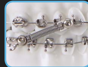
NiTi-Feder aufstecken, mit Inbusschraube befestigen