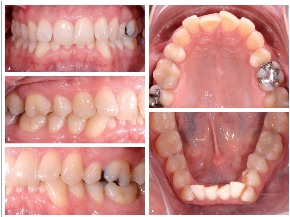
Abb. 3a-e: Anfangssituation Fall 3.