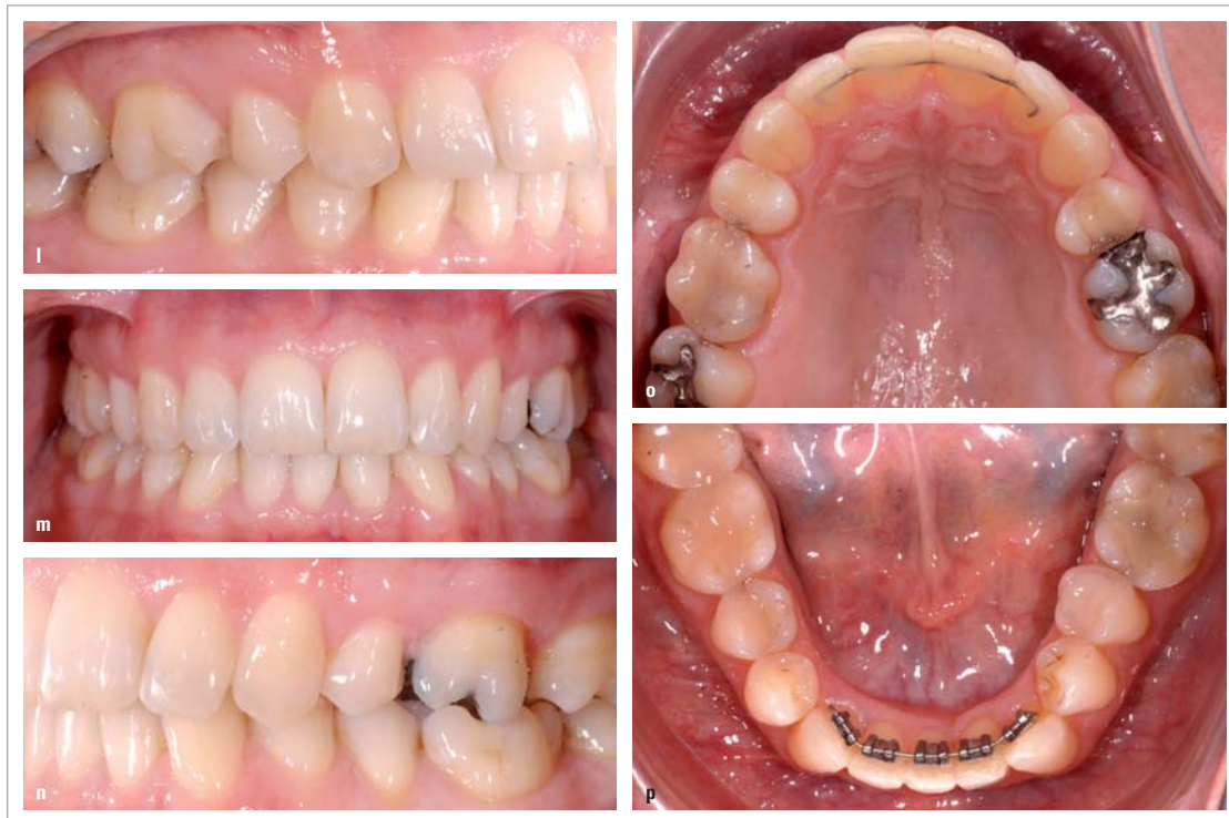
Abb. 3l-p: Resultat von Fall 3 nach einem Jahr Behandlungszeit. Zahn 43 wird noch weiter rotiert.