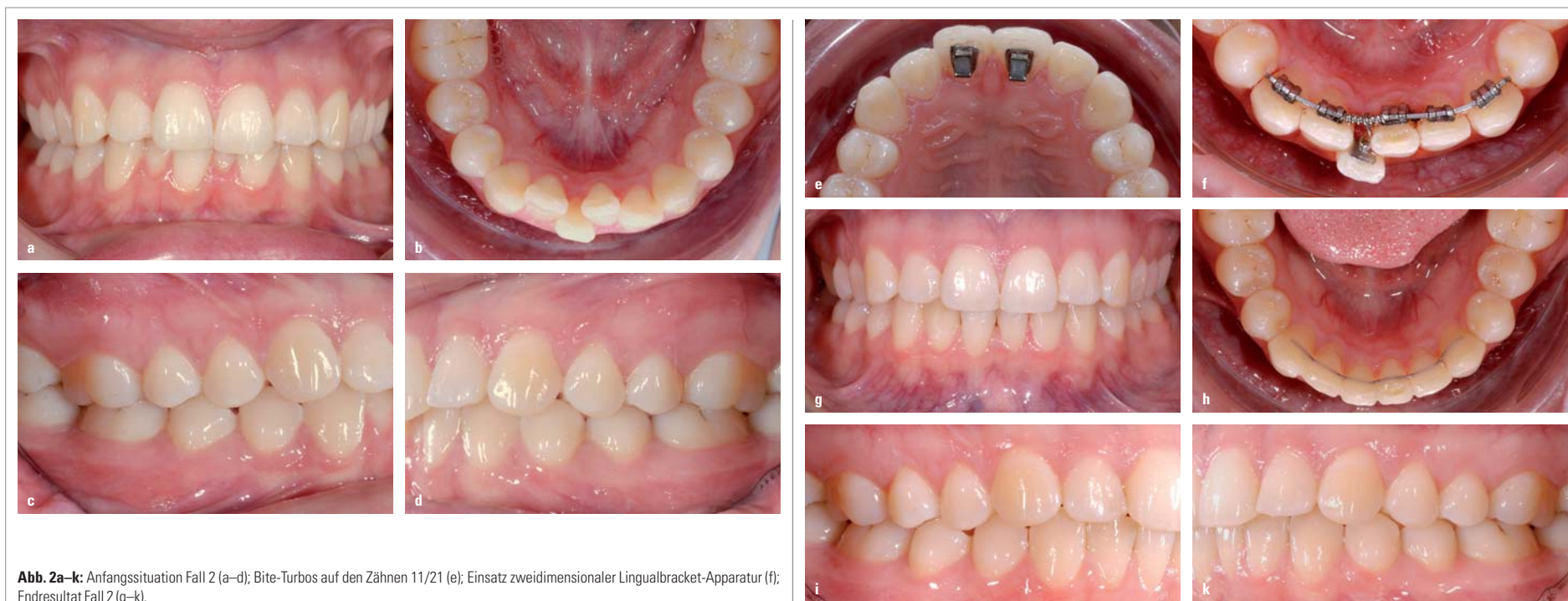
Abb. 2a-k: Anfangssituation Fall 2 (a-d); Bite-Turbos auf den Zähnen 11/21 (e); Einsatz zweidimensionaler Lingualbracket-Apparatur (f); Endresultat Fall 2 (g-k).

Ob sich bei ASR das Kariesrisiko erhöhen könnte, wurde in verschiedenen Arbeiten untersucht. Björn Zachrisson untersuchte 61 Patienten, zehn Jahre nachdem ein Slicing/Stripping durchgeführt wurde. Es konnten keine iatrogenen Schäden festgestellt werden. 1 In einer weiteren Publikation von Zachrisson wurden Patienten mit ASR im anterioren und posterioren Bereich untersucht. Hier wurde ebenfalls kein erhöhtes Kariesrisiko festgestellt. 2