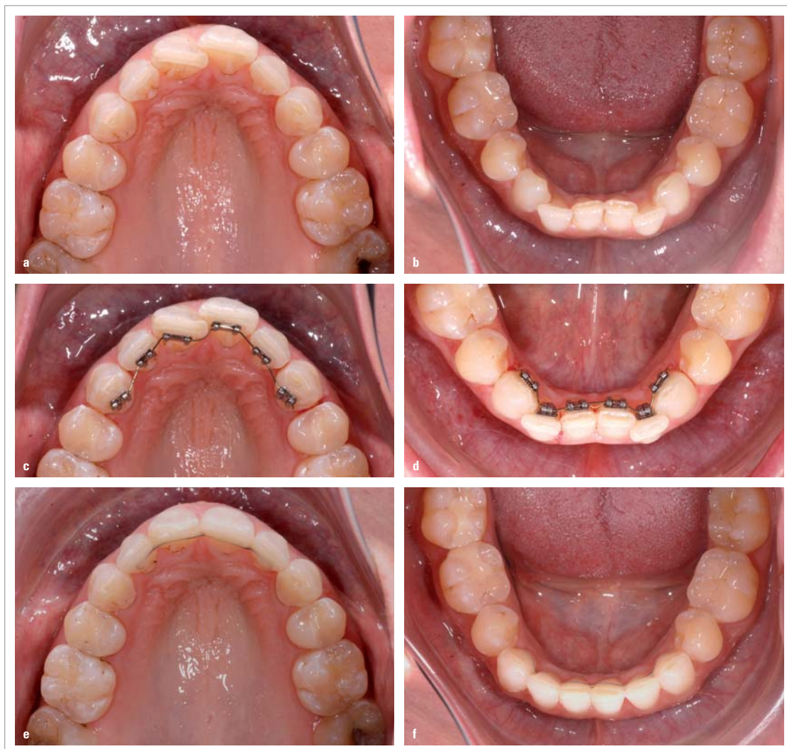
Abb. 1a-f: Anfangssituation Fall 1 (a, b); Einsatz zweidimensionaler Lingualbracket-Apparatur (c, d); Endresultat Fall 1 (e, f).

Ein Beitrag von Dr. Theophil Gloor, Kieferorthopäde aus Basel/Schweiz.