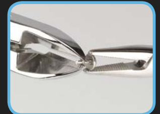
Bei Bedarf wird die Schraube gekürzt und der Pivot gleitet am Bogen.