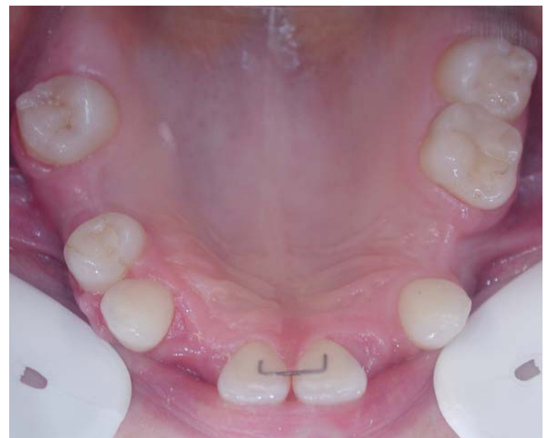
Abb. 4: Situation nach abgeschlossener KFO.