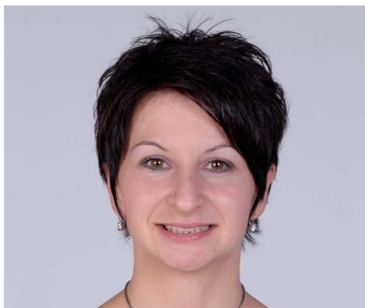
Abb. 6 und 7: Situation nach komplett abgeschlossener Behandlung.