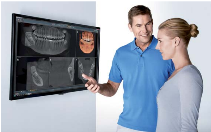
Erfahrene Referenten stehen den DVT-Neuanwendern kollegial zur Seite.

Ein zertifizierter DVT-Fachkudkurs der Sirona Dental Akademie in Bensheim vermittelt die Grundlagen des 3-D-Röntgens. Teilnehmer erfüllen damit gleichzeitig ihre Pflicht zur Aktualisierung der Fachkunde im Strahlenschutz. Entsprechend den Leitsätzen und Empfehlungen der BZÄK und der DGZMK erhalten (Fach-)Zahnärzte für die Teilnahme 21 Fortbildungspunkte.