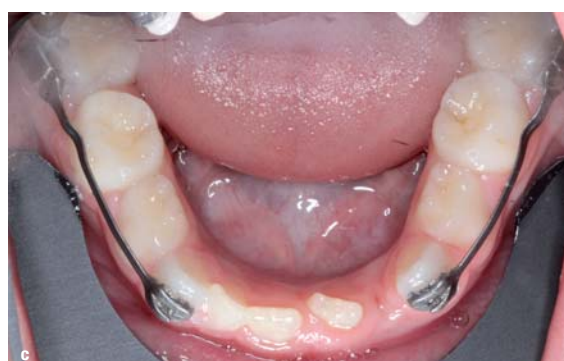
Abb. 9a-c: Initiale intraorale Aufnahmen mit eingegliedertem Motion™ Klasse III-Apparatur.