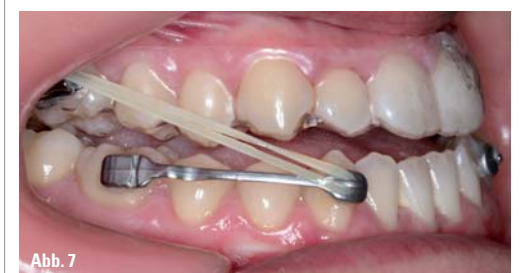
Abb. 6a, b: Initiale Profilaufnahme (a) sowie nach dreimonatiger Behandlung mit der Motion™ Klasse III-Apparatur (b). – Abb. 7: Initiale intraorale Aufnahme.