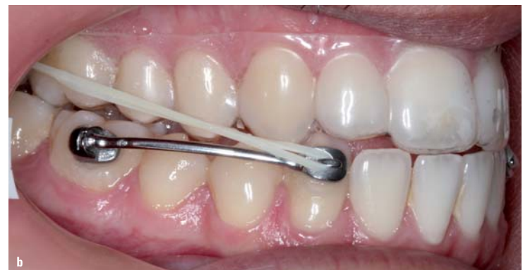
Abb. 13a, b: Initiale intraorale Aufnahme mit eingegliedert Motion™ Klasse III-Apparatur (a) und nach fünfmonatiger Behandlung.

dentale Aspekte. Wir versuchen, eine gute Okklusion der Molaren und Eckzähne zu realisieren, die Mittellinie zu korrigieren, Überbiss, Overjet etc. Und oft fokussieren wir uns dabei zu sehr auf die Zähne. Der Patient ist jedoch ein Mensch mit einem Gesicht, einer bestimmten Knochenposition, Zähnen und allem, was korrigiert und ausgeglichen gehört. So sollte dem Patienten ein schönes Gesicht mit schönen faziellen Proportionen und Relationen gegeben werden. Wir sollten niemals