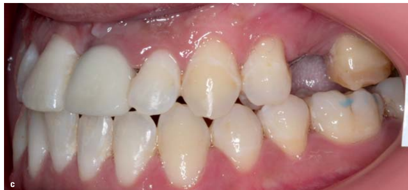
Abb. 5a-c: Initiale intraorale Aufnahme (a), nach einmonatiger Behandlung mit der Motion™ Klasse III-Apparatur (in Abb. 5b ist der transparente Prototyp abgebildet, welcher noch nicht erhältlich ist) und finale Aufnahme nach 14-monatiger Behandlungszeit (c).