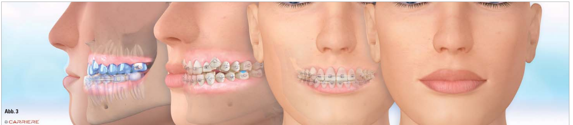
Abb. 3 CARRIÈRE