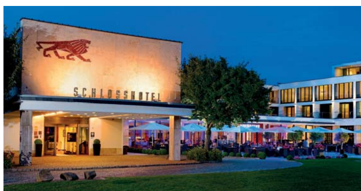
Veranstaltungsort des ODS-Kurses ist das Schlosshotel Bad Wilhelmshöhe in Kassel.