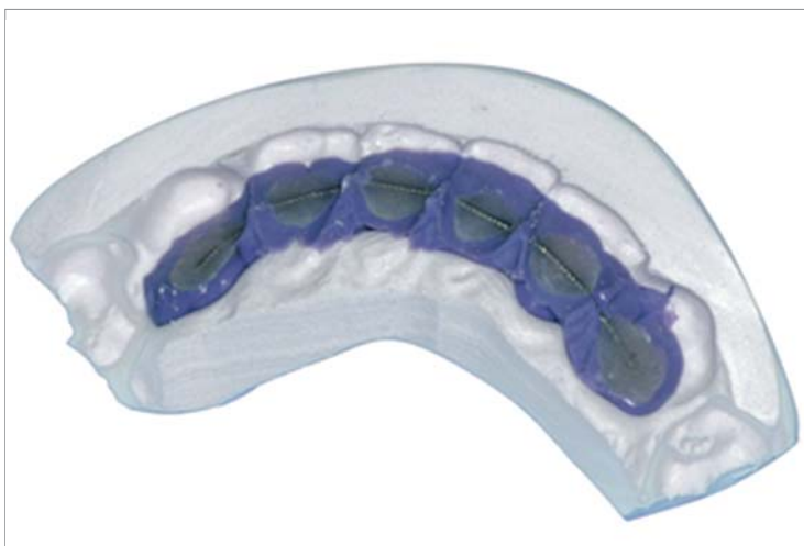
Abb. 6: Silikonschlüssel zweiphasig.