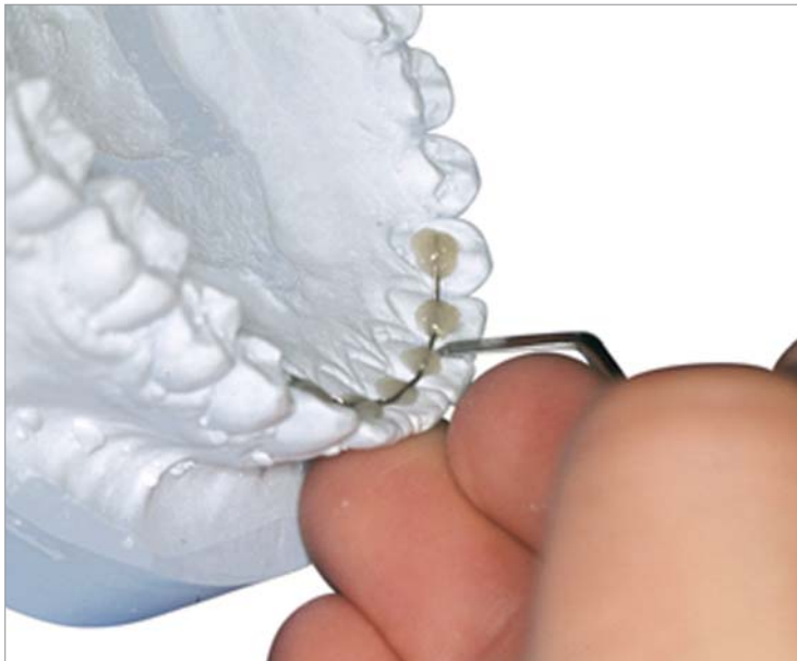
Abb. 5: Bracket/Attachment auf Modell kleben, Klebebasis.