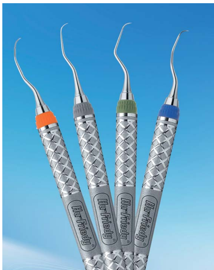
BioGent-Küretten von Hu-Friedy.