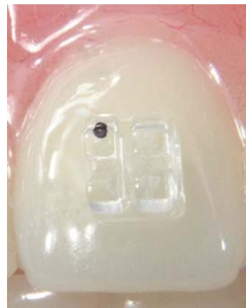
GHIACCIO wird höchsten ästhetischen und biomechanischen Ansprüchen gerecht.

che zu zwei Dritteln mit Mikroperlen aus Zirkonia versehen ist. Diese Perlen verbessern zum ei-