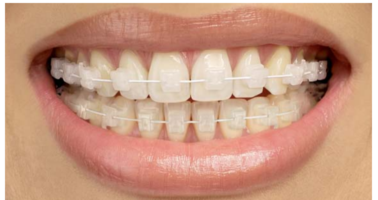
Ästhetik pur: Das vollästhetische Keramikbracket TruKlear® wurde um Brackets für den Unterkiefer ergänzt und ist jetzt von 5-5 OK/UK (3-5 mit Haken) erhältlich.

Noch in diesem Jahr lieferbar sein wird die dritte Generation des Keramikbrackets QuicKlear®. Das modifizierte, aktive SL-Bracket ist bis zu 0,4 mm flacher und weist eine rundere Form für einen noch besseren Tragekomfort auf. Die beliebten, von 5-5 im OK/UK (3-5 mit Haken) beziehbaren Brackets sind des Weiteren mit einem breiteren, rechteckigen Clip ausgestattet, dessen matte und weniger reflektierende Klammer eine optimale Rotations-, Angulations- und Torquekontrolle gewährt.