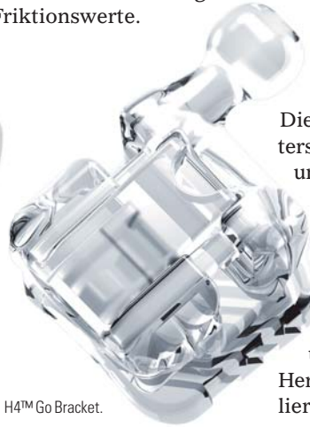
H4™ Go Bracket.

H4™ Go, das vollkommen transparente selbstligierende Bracket aus den USA, wird höchsten ästhetischen Ansprüchen gerecht. Hergestellt aus einem Hybridmaterial mit hohem Keramikfüllanteil, bietet es eine hohe Stabilität in Kombination mit problemlosem Bonding und Debonding. Der Schiebemechanismus ist aus anderen Systemen bekannt und bewährt. Das Material weist geringste Friktionswerte auf. Außerdem wurde das selbstligierende Keramikbracket ClearViz+™ SL in das Lieferprogramm aufgenommen. Die Rhodiumbeschichtete Klappe liegt mit einem Punktkontakt auf dem Bogen und bietet ebenso äußerst geringe Friktionswerte.