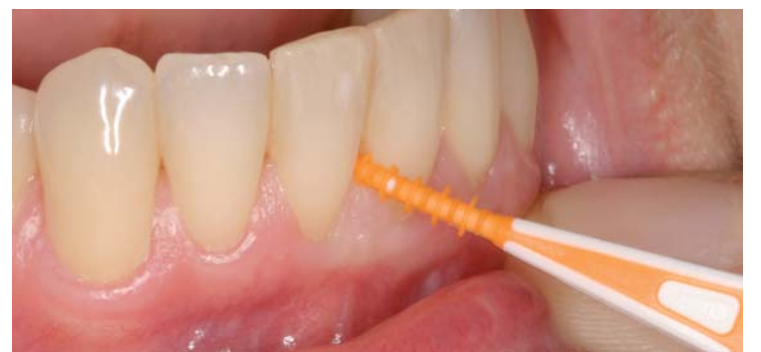
TePe EasyPick™ – in zwei Größen erhältlich.