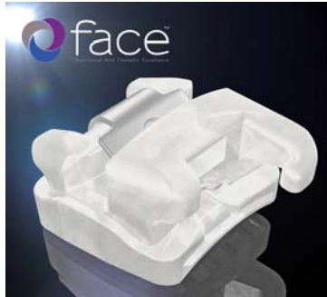
FACE Evolution steht als aktives selbstligierendes Bracketsystem oder optional als Hybridversion mit aktivem anterioren Segment und passiven Brackets auf Eckzähnen und Prämolaren zur Verfügung. Es wird mit den Brackets BioQuick® und QuicKlear® in den Slotgrößen .022" und .018" mit und ohne Haken angeboten.

Einer der bedeutendsten internationalen Termine des Fachbereichs Kieferorthopädie fand Mitte Juni im italienischen Venedig statt – der Jahreskongress der European Orthodontic Society (EOS). Rund 60 Dentalfirmen aus aller Welt präsentierten in der Stadt der Gondoliere jüngste Innovationen sowie bewährte Produkte. Unter ihnen selbstverständlich auch FORESTADENT, welches insbesondere bei den Brackets mit Neuheiten aufwartete. So stellte das Pforzheimer Unternehmen u. a. FACE Evolution vor, die weltweit erste und exklusiv bei FORESTADENT erhältliche Brackettechnik der renommierten FACE-Gruppe. Gemäß deren Behandlungsphilosophie – näm-