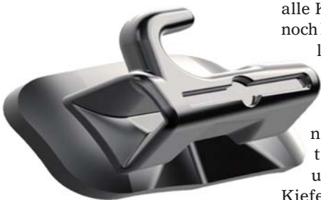
Mit noch höherem Nutzen für Behandler und Patienten: die neuen Victory Series™ Superior Fit Bukkalröhrchen.

Erst im Juli hat 3M Unitek eine neue Generation der bewährten Bukkalröhrchen eingeführt: die Victory Series Superior Fit Bukkalröhrchen mit einer Reihe deutlicher Verbesserungen. Und schon jetzt folgt als Produkterweiterung