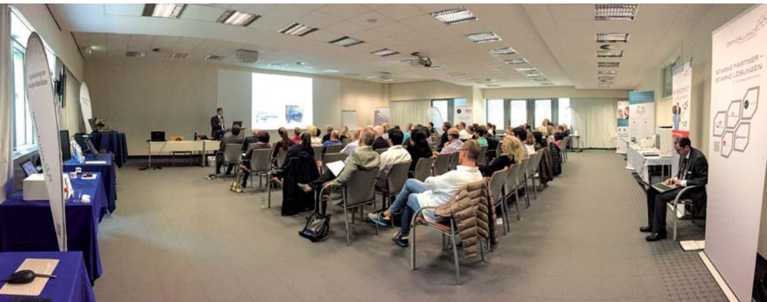
Großes Interesse am Thema „Digitale Kieferorthopädie“ konnten die Veranstalter verzeichnen. Im Bild: die Fortbildung in Herne.

Im Januar begann die erfolgreiche OrthoAlliance® Fortbildungsreihe mit der Auftaktveranstaltung in Ispringen. Die Dentaforum-Gruppe beendete diese nun mit einer gut besuchten Fortbildung zum Thema „Digitale Kieferorthopädie“ in Berlin. Mehr als 50 Kieferorthopäden, Zahnärzte und Zahn-techniker nahmen an dieser letzten Veranstaltung im Jahr 2015 teil. Im akademischen Rahmen des CharitéCentrums 3 konnten sich die Teilnehmer über die Vorteile der Digitalisierung von Abläufen in ihrem Praxis- und Laboralltag informieren.