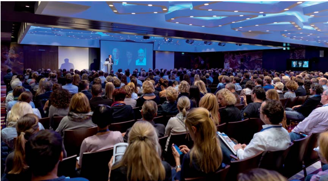
Blick von hinten ins Publikum des Zwei-Tages-Kurses.

20 Jahre Passiv-Selbstligierend – Rückblick & Chancen.