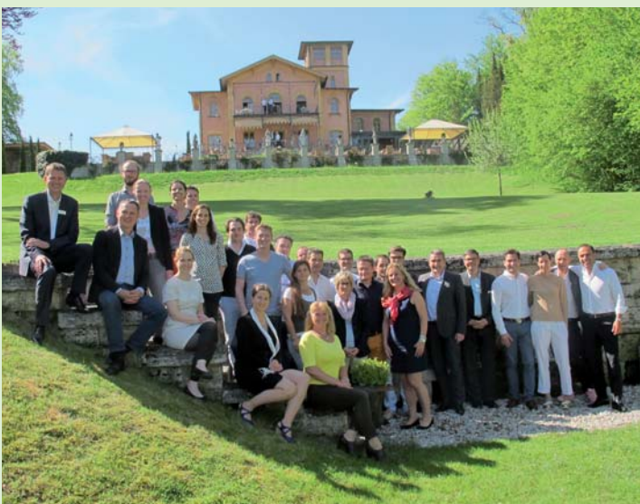
Gut angekommen: das Treffen der Incognito-Experten im Tagungshotel La Villa.

Informationen und Erfahrungsaustausch am Starnberger See.