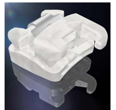
Noch flacher, runder und mit einem neuen Clip ausgestattet wurde QuickKlear® III, die neueste Generation des beliebten SL-Keramikbrackets von FORESTADENT.

Pin sowie eine Abdruckkappe helfen zudem bei der laborseitigen Fertigung der Apparatur. Abgerundet wurde FORESTADENTs diesjähriger DGKFO-Messeauftritt durch die Präsentation seines neuen Unterneh-