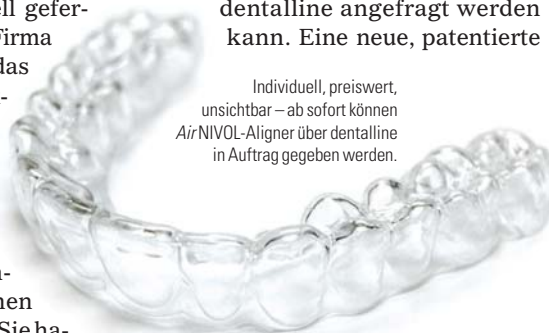
Individuell, preiswert, unsichtbar – ab sofort können Air NIVOL-Aligner über dentalline in Auftrag gegeben werden.

ner an die Praxis geschickt und je nach Behandlungsfortschritt die zweite. Korrekturen und Komplettierungen können jederzeit kostenfrei erfolgen. Voraussetzung für die Anwendung des Air NIVOL-Systems ist ein absolvierter Zertifizierungskurs, der bei dentalline angefragt werden kann. Eine neue, patentierte