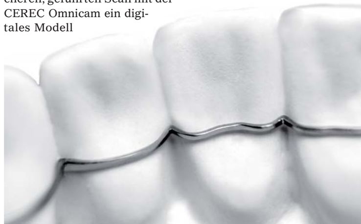
CA DIGITAL hat sich auf die Herstellung kieferorthopädischer Apparaturen spezialisiert und bietet präzise Lösungen für verschiedene Indikationen an, wie z. B. den MEMOTAIN® CAD/CAM-Retainer aus Nitinol®.

talen Modelle dann zur Planung verschiedener Apparaturen genutzt, die über eine Simulation virtuell direkt mit dem Behandler abgestimmt werden können. Neben den Alignern für die Schienentherapie wird dieser Workflow bei CA DIGITAL auch für die Erstellung vieler KFO-Apparaturen wie indirekte Klebeschienen oder CAD/CAM-gefertigte Retainer aus Nitinol® für Kunden aus der ganzen Welt angewandt. Alle Produkte werden komplett digital hergestellt. Hier verfügt CA DIGITAL über modernste Technologie. Das für die Archivierung nötige physische Modell erstellt das Unternehmen mit einem 3-D-Drucker. Der große Vorteil für Behandler und Patient: Die Therapie kann deutlich früher beginnen.