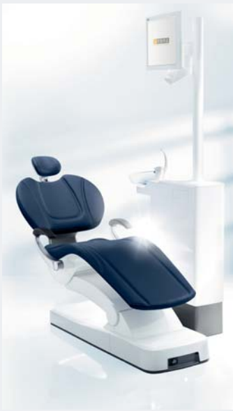
Das Material des Lounge-Polsters hat eine äußerst angenehme Haptik, ist hochwertig verarbeitet und verleiht INTEGO pro eine edle Erscheinung.

INTEGO pro Behandlungseinheit ab sofort mit komfortablem Polster in den Farben Mokka, Pazifik und Carbon verfügbar.