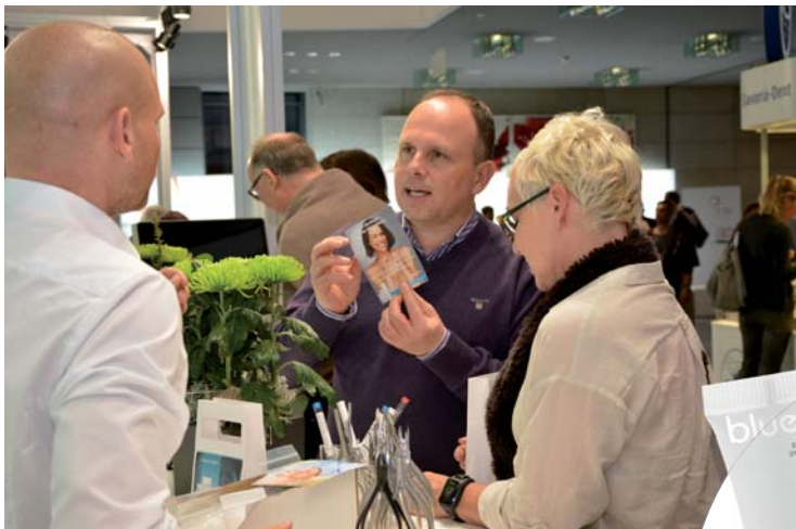
Traf auf großes Interesse: die mit aktivem Sauerstoff angereicherte blue ® m Pflegeserie. Diese trägt auch im Rahmen kieferorthopädischer Behandlungen effektiv zur Wundheilung und Schmerzlinderung bei.

dentalline präsentiert in Mannheim revolutionäre blue ® m Mundpflegeserie sowie weitere Produktinnovationen.