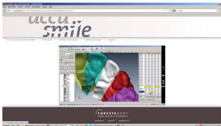
Am digitalen Accusmile® Infopoint konnten sich interessierte Messebesucher über den neuen FORESTADENT Service informieren. Dieser ermöglicht auf Basis der Orchestrate 3D Software die digitale Planung und Fertigung von Alignern – und das bei vollständiger Kontrolle aller Behandlungsphasen. Parallel zum Service steht Patienten und Behandlern mit www.accusmile.de ein neues Informationsportal zur Verfügung.

„Perspektiven in Diagnostik und Therapie“ – so lautete das diesjährige Motto des DGKFO-Jahreskongresses, der damit u.a. auch die fortschreitende Digitalisierung in kieferorthopädischen Praxen aufgriff. Welche Möglichkeiten und Chancen mit dieser Entwicklung verbunden sind und welche positiven Auswirkungen sie auf den täglichen Praxisworkflow haben kann, erfuhren die Kongressteilnehmer auch am FORESTADENT Messestand. So präsentierte das Pforzheimer Unternehmen seinen neuen Service Accusmile®. An einem digitalen Accusmile® Infopoint konnten interessierte Kieferorthopäden erfahren, wie auf Basis der Orchestrate 3D Software die digitale Planung und Fertigung von Behandlungsapparaturen wie Aligner ermöglicht wird. Zudem wurde den Standbesuchern gezeigt, wie Therapie-