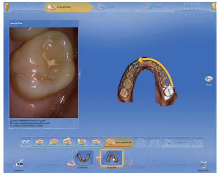
CEREC Ortho Software: Mit einem geführten Scan werden die Kiefer digital abgeformt. Die daraus entstehenden Daten können über die Software digital versendet werden.