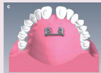
Abb. 1a-c: Ausgangssituation (a), Ergebnis (b) und skeletale Retention (c).