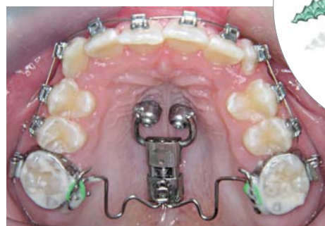
Unschlagbares Doppel – der neue Frosch II mit den ebenfalls neuen OrthoEasy® Pal-Pins, welche im Schraubenkopf mit einem Innengewinde ausgestattet sind und daher ein einfaches Aufschrauben der Apparatur ermöglichen.

Behandlungsphasen. Zudem punktet der Service durch ein brandneues, hilfreiches Tool – die Accusmile® Website. Unter www.accusmile.de erfahren Pa-