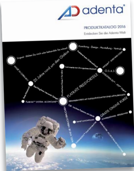
Noch bis zum 29. Februar 2016 können sich KFO-Praxen für eine der drei attraktiven Adenta Flatrates 2016 registrieren.

Druckfrisch ist er, der neue Adenta Produktkatalog 2016. Und mit ihm startet der Gilchinger Dentalanbieter eine ganz besondere Aktion – die Adenta-Flatrate. Diese soll neben etablierten bzw. größeren Praxen vor allem auch kleinen, z.B. Neustarter-Praxen, zugutekommen und deren Treue beim Materialeinkauf belohnen. Wer eine kieferorthopädische Praxis gründet oder übernimmt, kann die Anzahl der pro Jahr zu behandelnden Fälle oft noch nicht abschätzen. Es fehlen einfach die Erfahrungswerte, die sich anfangs in vielen Bereichen des Praxisalltags bemerkbar machen. So auch beim Bestellen der Behandlungsapparaturen samt Zubehör. In der Regel gilt hier: