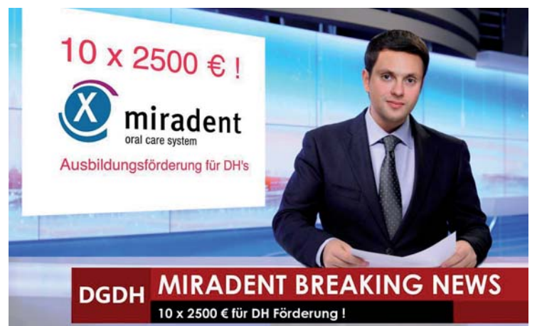
Die zehn Stipendiatinnen für das kommende Jahr stehen nun fest.

Die Teilnehmerinnen des miradent Förderprogramms für Dentalhygienikerinnen stehen fest.