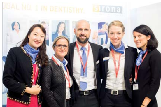
Abb. 1: Auf der SinoJobs-Messe standen HR-Mitarbeiter von Sirona den interessierten chinesischen Bewerbern für Fragen zur Verfügung. – Abb. 2: Der Sirona-Stand auf der Messe in München war eine gut besuchte Anlaufstelle für Bewerber.

Für das China-Geschäft sucht Sirona motivierte Kandidaten: „Aufgrund unseres stetigen Wachstums in China steigt der Bedarf an Mitarbeitern aller Fachrichtungen. Wir sind auf der