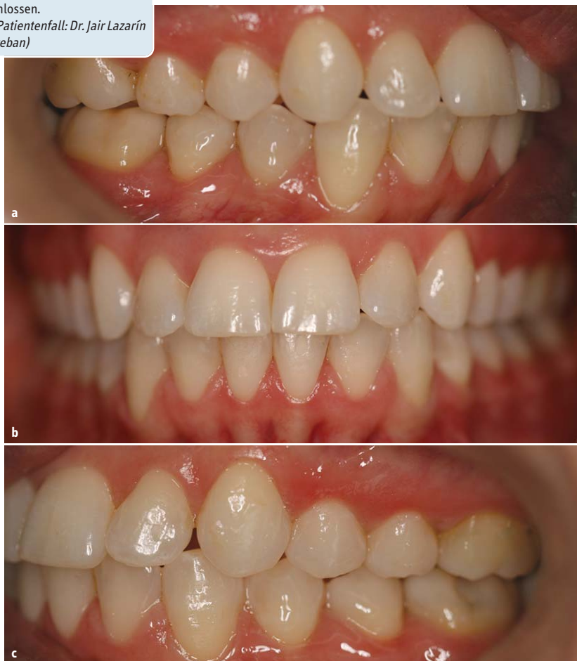
Abb. 6a–c: Innerhalb von zwölf Monaten war die Klasse II-Behandlung abgeschlossen.

Der Behandlungsplan sah den Einsatz von Clarity™ ADVANCED Keramikbrackets mit .022"er Slot, MBT™ Appliance System Rx, mit -6^\circ Torque für die unteren Schneidezähne sowie einer Forsus™ Apparatur zur Korrektur der Klasse II-Malokklusion vor.