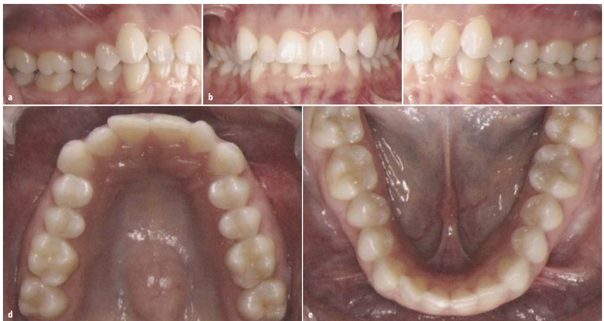
Abb. 2a–e: Initiale Aufnahmen vor Behandlungsbeginn.

deutlich: Am liebsten möchten sie gar keine Brackets tragen, oder wenn, dann zumindest eine sehr ästhetische Lösung wie etwa Aligner oder linguale Apparaturen. An zweiter Stelle