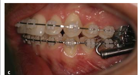
Abb. 5a–c: Nach den ersten sechs Behandlungsmonaten wurde die Forsus™ Apparatur eingesetzt.