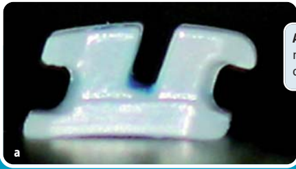
Abb. 1a, b: Clarity™ ADVANCED Keramikbracket (a); zum Vergleich das Bracket eines anderen Herstellers (b).