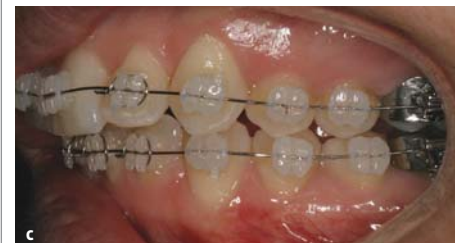
Abb. 4a–c: Nach dem Kleben der Brackets wurde ein .012"er Nitinolbogen eingesetzt; auf den oberen linken und den vier unteren Schneidezähnen zusätzlich straffe Metallligaturen, um die Rotation zu regulieren.