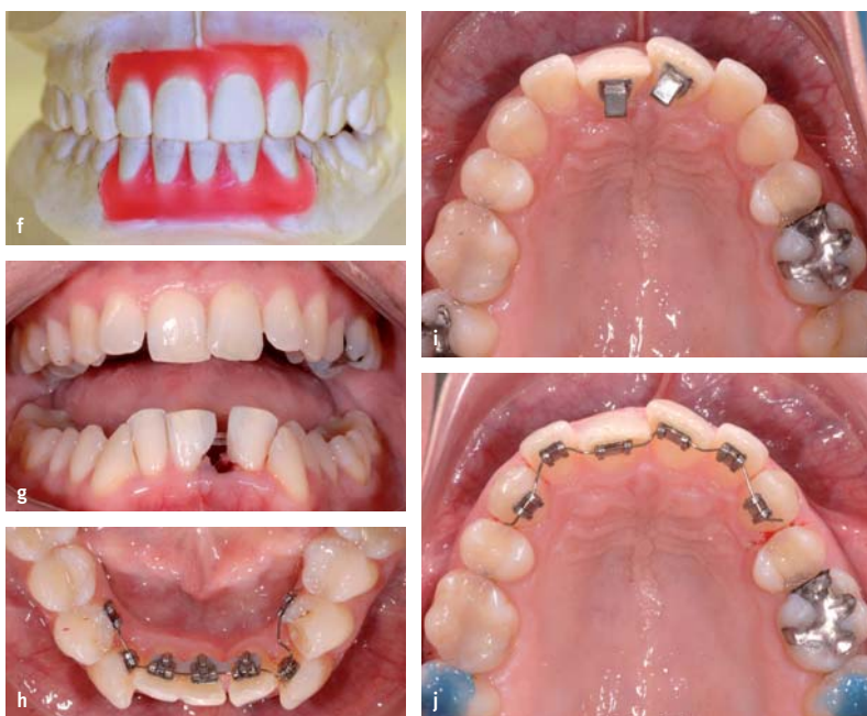
Abb. 3f–j: Set-up mit Inzisiven-Extraktion (f); Komposit approximal Zahn 32 und 41 (g); Bite-Turbos auf den Zähnen 11 und 21 (i); Einsatz zweidimensionaler Lingualbracket-Apparatur (h, j).

In einer zweiten Phase wurden die Bite-Turbos entfernt und auch die Oberkieferfront nach ASR mit einer zweidimensionalen Lingualapparatur eingereiht (Abb. 3j). Nach einer Behandlungszeit von einem Jahr muss nur noch 43 weiter distal ausrotiert werden (Abb. 3k bis o).