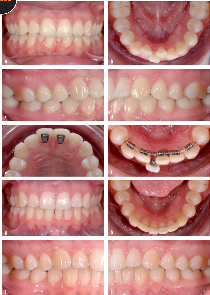
Abb. 2a–j: Anfangssituation Fall 2 (a–d); Bite-Turbos auf den Zähnen 11/21 (e); Einsatz zweidimensionaler Lingualbracket-Apparatur (f); Endresultat Fall 2 (g–j).

Im Seitenzahnbereich hilft oft ein im Approximalbereich applizierter Keil. Er erleichtert das Einführen der Orthostrips und schützt die Gingiva. Eine Fluoridierung nach erfolgtem Slicing/Stripping führt zu einer schnellen Remineralisierung und macht daher Sinn. Anhand von vier Fallbeispielen sollen im Folgenden mögliche Grenzen der ASR sowie Alternativen aufgezeigt werden.