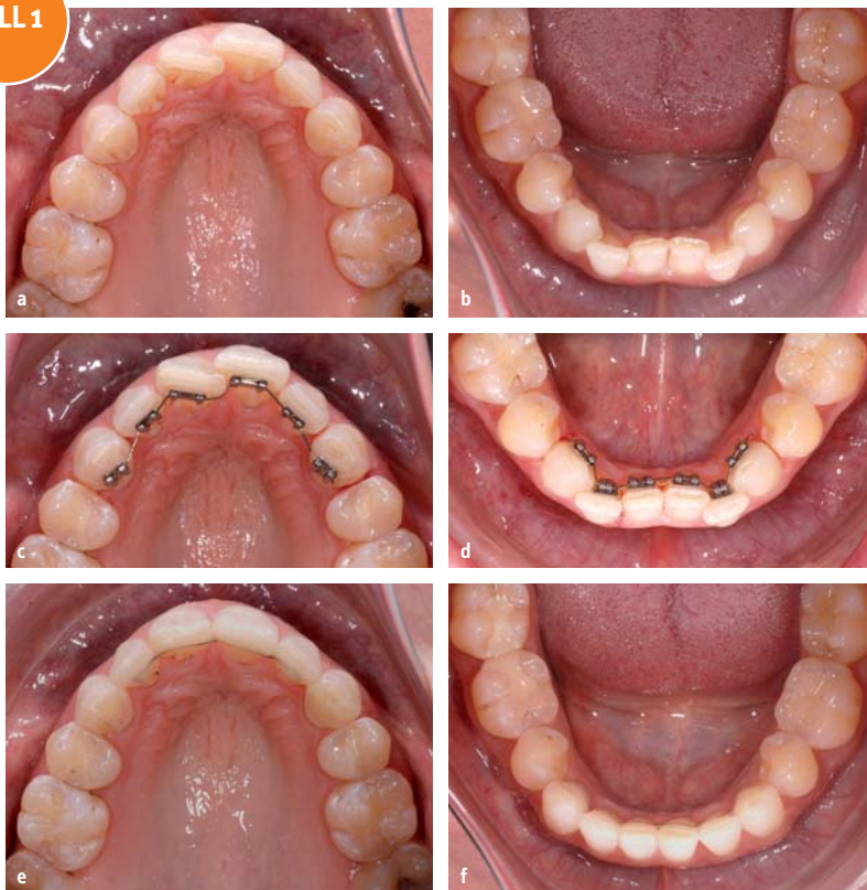
Abb. 1a–f: Anfangssituation Fall 1 (a, b); Einsatz zweidimensionaler Lingualbracket-Apparatur (c, d); Endresultat Fall 1 (e, f).