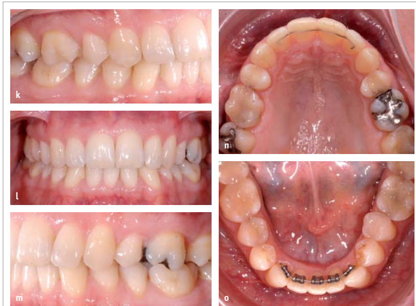
Abb. 3k–o: Resultat von Fall 3 nach einem Jahr Behandlungszeit. Zahn 43 wird noch weiter rotiert.

Oberkiefer und nach neun Monaten im Unterkiefer kamen die zweidimensionalen Lingualapparaturen im Frontbereich dazu (Abb. 4e und f). Die Abbildungen 4g und h zeigen das Endresultat nach 14 Monaten Behandlungszeit.