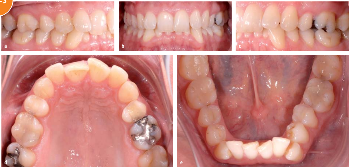
Abb. 3a–e: Anfangssituation Fall 3.

Für die Einreihung der Unterkieferfront kamen drei Behandlungsvarianten infrage: Zirkuläres Slicing/Stripping, Extraktion eines Inzisiven, Extraktion der beiden ersten Prämolaren im Unterkiefer. Die Variante der Prämolarenextraktion schied wegen der schönen Klasse II-Verzahnung im Molaren- und Prämolarenbereich aus.