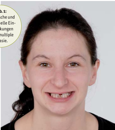
Abb. 1: Ästhetische und funktionelle Einschränkungen durch multiple Aplasie.