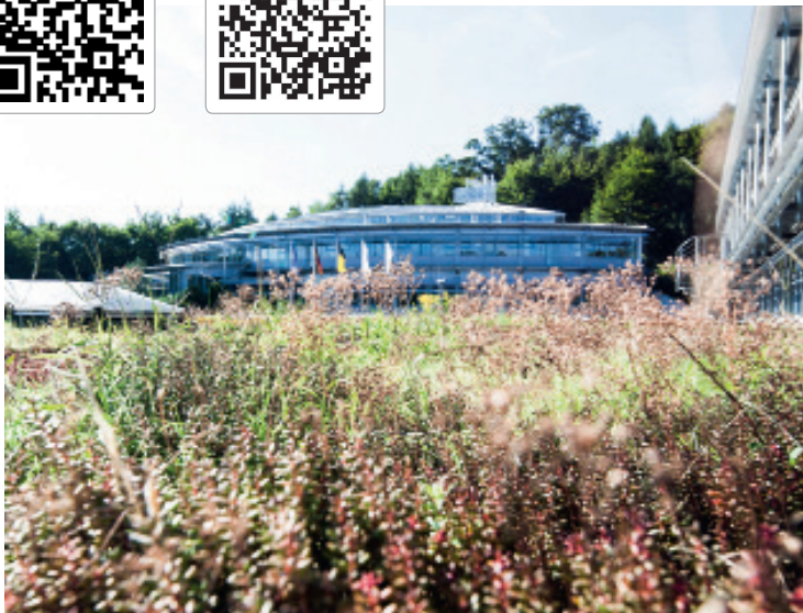
Vielfältige Begrünung auf den Firmendächern der Dentaurum-Gruppe.