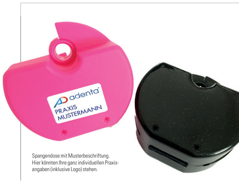
Spangendose mit Musterbeschriftung. Hier könnten Ihre ganz individuellen Praxisangaben (inklusive Logo) stehen.

lige Praxisdesign, indem es z.B. praxisindividuelle Klammerdosens oder Kiefermodellkästen anbietet. Aus über 20 verschiedenen Farben kann hierbei gewählt werden. Wer mag, kann sogar sein Praxislogo und einen flotten Spruch oder ein Motto mittels haltbaren Aufklebern hinzufügen. Wird vom Behandler pro Patient nicht nur eine bestimmte Brackettechnik oder Bogenform bevorzugt, sondern ein Mix aus verschiedenen Prescriptions oder Bogenformen, stellt auch das kein Problem dar. Adenta liefert, was Praxen wünschen,