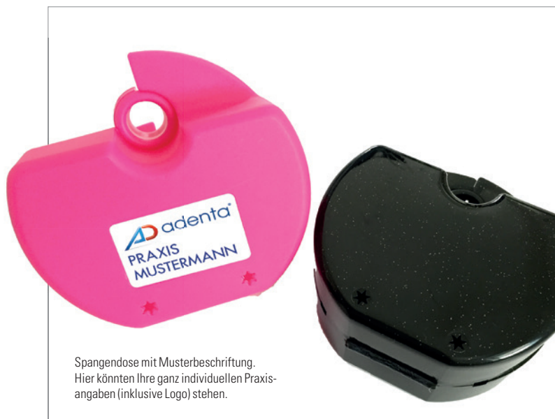
Spangendose mit Musterbeschriftung. Hier könnten Ihre ganz individuellen Praxisangaben (inklusive Logo) stehen.

lige Praxisdesign, indem es z.B. praxisindividuelle Klammerdosens oder Kiefermodellkästen anbietet. Aus über 20 verschiedenen Farben kann hierbei gewählt werden. Wer mag, kann sogar sein Praxislogo und einen flotten Spruch oder ein Motto mittels haltbaren Aufklebern hinzufügen. Wird vom Behandler pro Patient nicht nur eine bestimmte Brackettechnik oder Bogenform bevorzugt, sondern ein Mix aus verschiedenen Prescriptions oder Bogenformen, stellt auch das kein Problem dar. Adenta liefert, was Praxen wünschen,