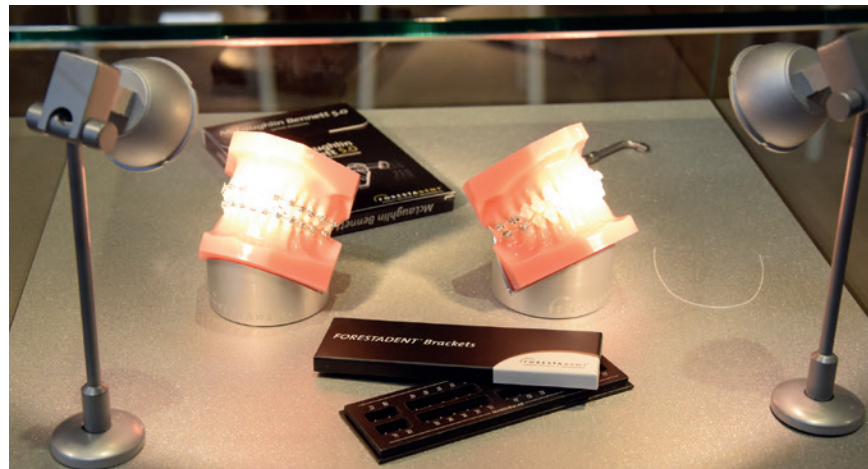
Die neuen Mini Sprint® II Brackets werden jetzt auch in der McLaughlin Bennett 5.0 Prescription angeboten. Die jüngste Version der McLaughlin/Bennett/Trevisi-Technik berücksichtigt bedeutende Erkenntnisse der letzten Jahre, die in Form angepasster Torque- und In/Out-Werte in die neue Prescription eingeflossen sind.

Deutschlandweiter Vertrieb von 3Shape-Produkten FORESTADENT gab in Bremen darüber hinaus seine Vertriebskooperation mit der dänischen