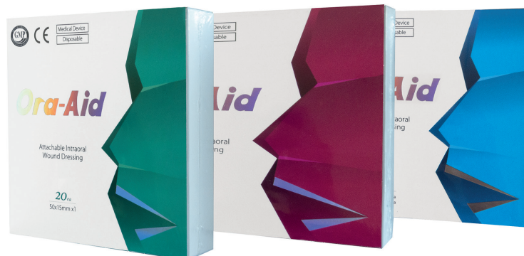
Die drei verschiedenen Produktpackagen enthalten jeweils eine andere Zusammenstellung der zwei verschiedenen Pflastergrößen von 50 x 15 mm bzw. 25 x 15 mm.