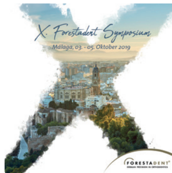
Vom 3. bis 5. Oktober 2019 lädt FORESTADENT zu seinem zehnten internationalen Fachsymposium nach Málaga.

Firma 3Shape bekannt. Deren Intraoralscanner TRIOS® 3, TRIOS® 3 Wireless, TRIOS® MOVE sowie das Softwarepaket Ortho Planner™ ergänzen DENTAreality 4.0 somit ideal. Der technische Support der 3Shape-Produktlösungen wird über TEAMZIEREIS realisiert.