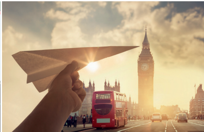
Abb. 1: Ein voller Erfolg – Excellere 2018 in Madrid. Abb. 2: Die Registrierung für Excellere 2019 in London ist unter www.3mexcellere.com ab sofort möglich!

Eine chinesische Weisheit besagt: „Wenn der Wind des Wandels weht, bauen die einen Schutzmauern und die anderen Windmühlen“. Zu Letzteren gehören die Referenten des 3M-Kongresses „Excellere 2019“, der am 17. und 18. Mai 2019 in London stattfindet. Basierend auf eigenen Erfahrungen berichten sie, wie es gelingen kann, den Wandel in der Kieferorthopädie zum eigenen Vorteil zu nutzen. Die Anmeldung zum Kongress ist on-