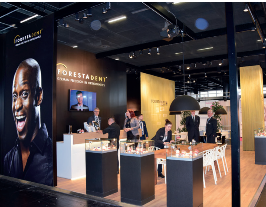
FORESTADENT begrüßte seine Gäste zur IDS mit einem einzigartigen Standkonzept. Dessen Design verwies durch Kettenvorhänge oder beleuchtete Vitrinen optisch auf die in der Schmuckindustrie verankerten Wurzeln des Traditionsunternehmens.

Die IDS stellt alle zwei Jahre die weltweit größte Plattform für zahnmedizinische Produktneuheiten dar. Neben Zahnärzten und Zahntechnikern sind stets auch viele Kieferorthopäden präsent, um sich über die Trends der Branche zu informieren. Am Stand von FORESTADENT konnten diese nicht nur jüngste Innovationen des Pforzheimer Dentalanbieters kennenlernen, sondern wurden zudem auf ein ganz besonderes Event in 2019 hingewiesen. So lädt FORESTADENT vom 3. bis 5. Oktober Kieferorthopäden aus aller Welt zu seinem X. Symposium nach Málaga ein. Nähere Informationen zu diesem Thema gibt es im Internet unter: www.forestadent.com/de-de/symposium-2019