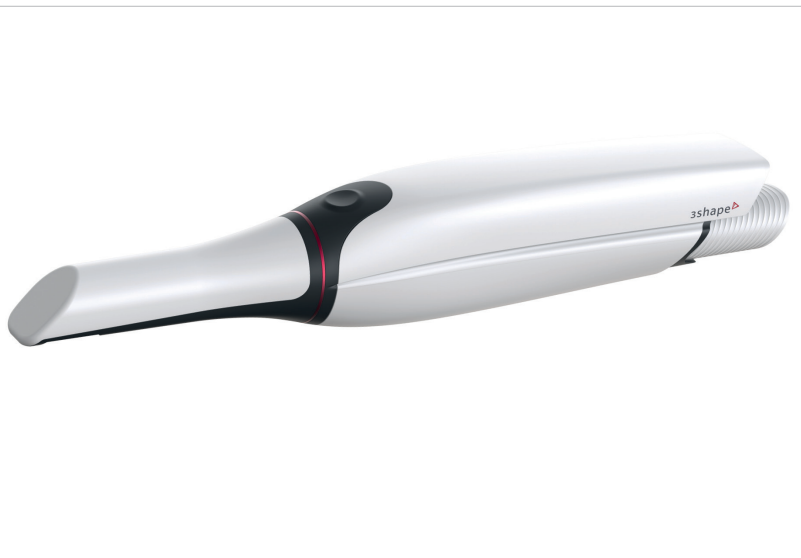
Mit TRIOS® 4 ist ab sofort die vierte Generation des bewährten Intraoralscanners von 3Shape über FORESTADENT verfügbar.

FORESTADENT zeigte zur IDS Produktlösungen für einen hochmodernen kieferorthopädischen Praxisworkflow.