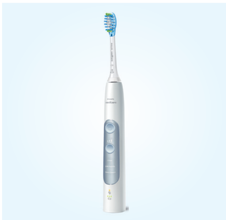
Philips Sonicare ExpertClean.

Die Sensortechnologie bietet noch weitere Vorteile: So kann das Putzverhalten umfangreich gemessen und analysiert werden. Noch während der Zahnreinigung gibt das Gerät ein Echtzeit-Feedback. Anschließend kann der Anwender über die Philips Sonicare App seinen Erfolgsbericht generieren, der es ihm ermöglicht, die eigenen Mundpflegegewohnheiten langfristig zu verbessern. Idealer-