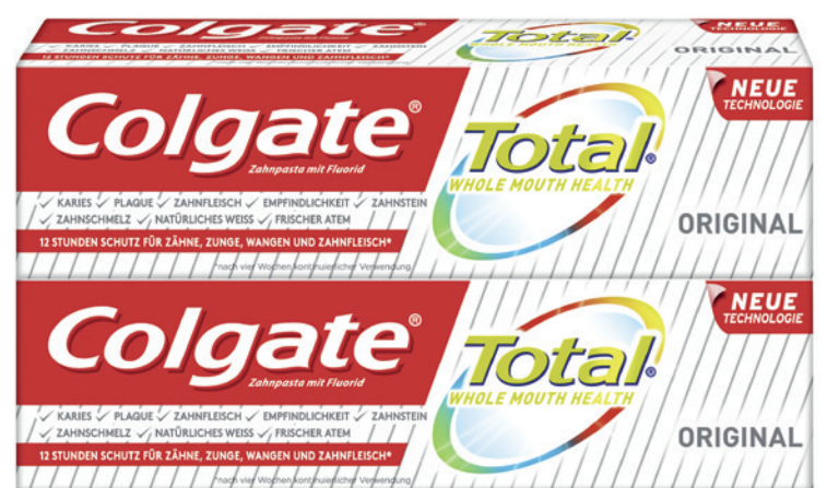
Die neue Colgate Total® Zahnpasta.

Die neue Colgate Total® ist eine Multi-Benefit-Zahnpasta mit einer umfassenden Palette an Vorteilen, darunter Schutz vor Plaque und Gingivitis, Karies, Dentinhypersensibilität, Säuren aus Lebensmitteln, Verfärbungen, Zahnstein und Halitosis. Neben der innovativen Formel aus dualem Zink und Arginin enthält Colgate Total® 1.450 ppm Fluorid. Für mundgesunde Patienten, bei denen keine besonderen therapeutischen Maßnahmen angezeigt sind, ist die neue fluoridhaltige Zahnpasta daher der ideale, zweimal tägliche Begleiter.