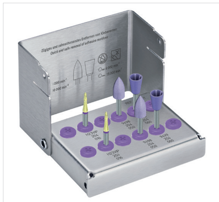
Professionelle Kleberestentfernung von A bis Z – mit dem Komplettsset 4688ST von Komet.

Als Komplettsset 4688ST bieten die Smoozies von Komet professionelle Kleberestentfernung von A bis Z. Unter Schonung der Zahnhartsubstanz sorgen sie gleichzeitig dafür, dass die Arbeit noch routinierter und zügiger abläuft. Kurzum: Ein Set für den gesamten Behandlungsablauf, einen erfolgreichen Abschluss und zufriedene Patienten.