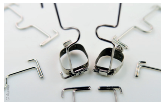
Adenta's Palatinalbügel nach Goshgarian – links die neue Variante mit verlängertem Schlossteil, rechts die bisherige, nicht weiter erhältliche Version mit kürzerer Retention.

Der Gilchinger Dentalanbieter Adenta bietet ab sofort einen modifizierten Palatinalbügel nach Goshgarian an. Im Gegensatz zu den am Markt erhältlichen Standard-Palatinalbügeln ist die neu über Adenta erhältliche Variante mit beidseitig verlängerter Retention ausgestattet. Dadurch wird dem Anwender nicht nur ein leichteres Einführen in die Lingualschlösser der Molarenbänder ermöglicht. Darüber hinaus kann auch eine bessere individuelle Anpassung des biegbaren Retentionsteils gewährleistet werden. Ein weiterer Vorteil, der mit der Verlängerung des geraden Schlossteils einhergeht, ist das einfachere Anbringen zusätzlicher Hilfsmittel wie z. B. intraoraler Gummizüge oder Stahlligaturen.