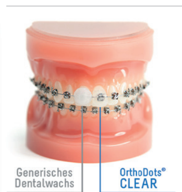
Sichtbarer Unterschied: links generisches Dentalwachs, rechts die neuen, transparenten OrthoDots® CLEAR.

OrthoDots® CLEAR werden in hygienischen, manipulationssicheren Einzeleinwegverpackungen (inklusive Kennzeichnung zur Produktrückverfolgbarkeit) zur sicheren und komfortablen Anwendung in der Praxis sowie zu Hause angeboten. Sie sind in Praxispackungen zu 48 Stück (ca. zehn Sekunden Stuhlzeit erforderlich) so-