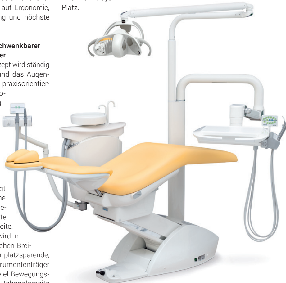
easy KFO 2 – einfach zuverlässig.

Platz. zensystem sorgt für angenehme und sichere Behandlung. Alle easy Einheiten sind mit der LED-Behandlungsleuchte Solaris 3 ausgestattet.