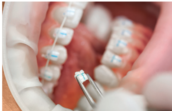
Abb. links: Einfaches Bonding dank 3M APC Flash-Free Vorbeschichtung: 3M Clarity Ultra SL Bracket im klinischen Einsatz. Abb. rechts: 3M Clarity Ultra SL Bracket: Testen des Klappenmechanismus auf der DGKFO-Tagung 2019.

Der Einsatz des ästhetischen vollkeramischen Klappen-