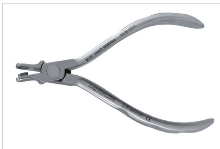
Auch das Angebot an Zangen und Instrumenten wurde erweitert.

z.B. Spezialzangen für die Alig-nertechnik, Biegezangen sowie Cutter.