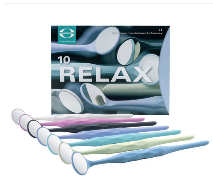
Ebenfalls neu im Produktprogramm ist der RELAX-Mundspiegel.

Der neue RELAX-Mundspiegel aus extrem leichtem, autoklavierbarem Kunststoff ist auch für den Thermodesinfektor geeignet. Er ist farb- und formstabil und resistent gegenüber Säuren und Plaque-Indikatoren. Das Instrument ist aus einem Stück mit planem Übergang gefertigt und bietet dadurch den Vorteil, dass es nicht zur Reinigung demontiert werden muss – eine echte Erleichterung bei der Instrumentenpflege. RELAX-Mundspiegel werden mit Rhodiumbeschichtung oder in Ultra FS für weltweit hellste und besonders scharfe Darstellung in sieben Farben angeboten. Aus gleichem