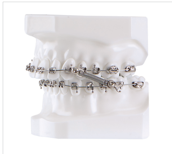
CS5 Twist-Lock™ Klasse II-Feder am Typodonten (links) und CS5 Twist-Lock™ Patientenkit.

Die Jubiläumsaktionen des Spezialanbieters für kieferorthopädische Produkte werden im zweiten Halbjahr 2020 fortgesetzt. Alle Neuheiten sind im Onlineshop einsehbar; es kann ein Angebotsflyer angefordert werden.