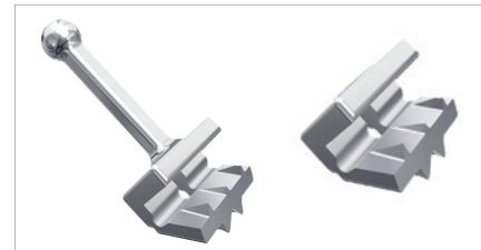
Shark Hooks und Stops.

innen liegenden kleinen „Zähne“ erhöhen die Friktion und drücken sich regelrecht in das Bogenmaterial hinein. Dadurch halten Haken und Stops sehr viel besser als übliche Produkte ohne zusätzliche Retentionen. Bei der Anbringung der Hooks empfiehlt sich die Haken-Klemmzange, bei den Stops können zum Festdrücken übliche Standardzangen, z. B. eine Spitzzange, benutzt werden.