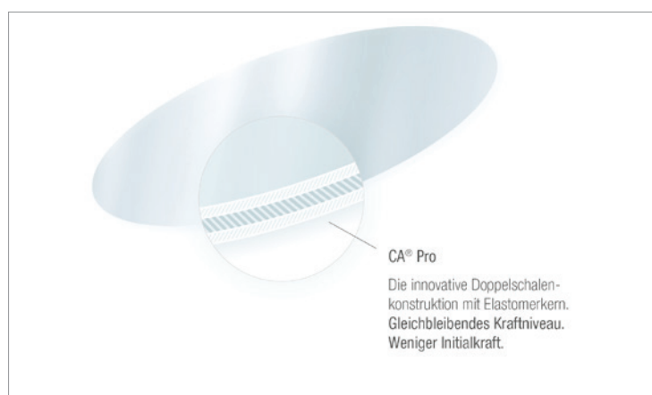
Folienquerschnitt CA® Pro.

Durch einen flexiblen Elastomerkern, der in einer hartelastischen Doppelschale eingebettet ist, behält die neue CA® Pro wesentlich länger ein konstan-