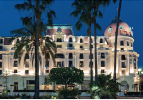
Veranstaltungsort ist das Negresco Hotel Nizza.

American Orthodontics lädt am 10. Dezember nach Nizza.