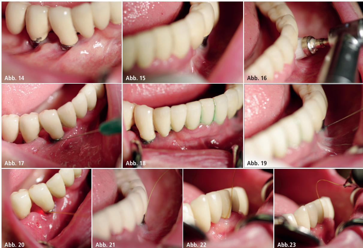
Abb. 14–23: Fallbeispiel – Im Sinne einer Full-Mouth-Desinfektion wird neben den von der Periimplantitis betroffenen Implantaten auch der Restzahnbestand des Unterkiefers mit der ICG-basierten Photodynamischen Therapie behandelt.

(bakterizide) Eigenwirkung hat, unterschieden. Bei der „echten“ PDT tritt der Zelltod des pathogenen Bakteriums ausschließlich durch die Interaktion zwischen Sensitizer und Laserlicht ein, bei der Sauerstoff entsteht. Als Folge geht die pathogene Zelle zugrunde. Eine weitere Unterscheidung der Photodynamischen Therapie kann bei den Sensitizern getroffen werden. Hier sind blaue (in der Regel mit bakterizider Eigenwirkung) und grüne (in der Regel ohne bakterizide Eigenwirkung) Farbstoffe im Einsatz. Im Fokus des aktuellen Interesses stehen zurzeit zweifellos Systeme mit grünem Sensitizer, die in der Regel auf ICG-Basis (Indocyaningrün) mit einem 810nm-Diodenlaser (nahes Infrarot) zum Einsatz kommen.