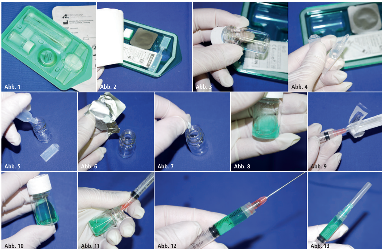
Abb. 1–13: Anmischen des Sensitizers. Im Set sind alle Bestandteile enthalten, um in einem Glasfläschchen die Farbstofftablette in einer bereitgestellten Flüssigkeit aufzulösen und zur gebrauchsfertigen Sensitizerlösung zu verarbeiten, die nach ca. 30 Minuten gebrauchsfertig ist und intraoral appliziert werden kann.

der DGL-Tagung 2012 über eine einheitliche Nomenklatur. In diesem Zusammenhang wird zwischen einer „echten“ PDT und einer, deren Sensitizer eine