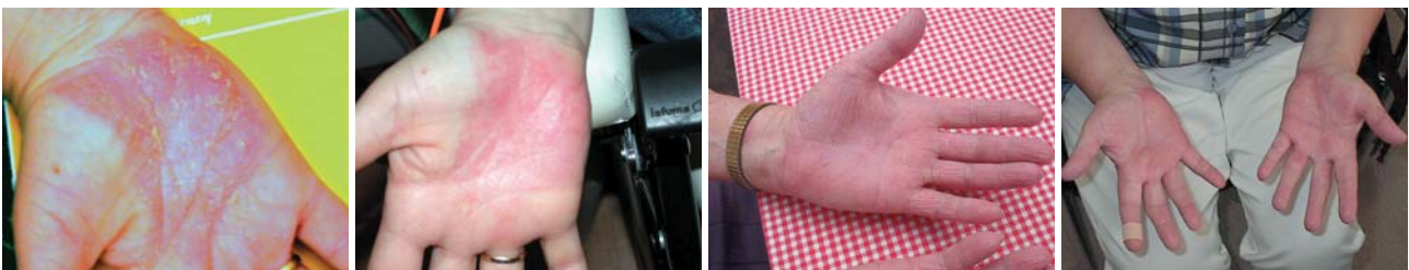
Abb. 1 und 2: Patientin mit undifferenzierter Spondylarthropathie, Parapsoriasis en plaque im Bereich der Hände vor und nach Behandlung mit dem invasiven Laser. – Abb. 3: Zustand vor der Lasertherapie. – Abb. 4: Zustand nach der Lasertherapie.

Der 50-jährige Patient gab an, plötzlich auf einem Auge schlechter sehen zu können. Die Untersuchung in einer Augenklinik ergab folgenden Befund: Papille im linken Auge toto geschwollen, peripapillare Blutungen, Makula-Ödem, superiore Blutungen, periphere Blutungen nasal, temporal und vor allem superior. Daraufhin wurde er mit Vasonit (Pentoxifyllin) behandelt. Circa zwei Wochen später wurde eine erneute Kontrolle vorgenommen, die jedoch einen unveränderten Befund ergab. Unmittelbar nach dieser Kontrolle wurde mit der invasiven Laserblutbehandlung begonnen. Nach weiteren zwei