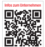
Infos zum Unternehmen

Henry Schein Dental Deutschland Tel.: 06103 7575000 www.henryschein-dental.de