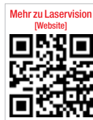
Mehr zu Laservision (Website)

LASERVISION GmbH Tel.: 0911 9736-8100 www.uvex-laservision.de