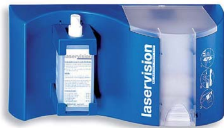
Reinigungsstation mit Reinigungsflüssigkeit und Putztüchern.

Eine unsachgemäße Behandlung oder Reinigung verursacht unter Umständen Kratzer oder kann im Einzelfall die Brille bzw. die Filtereigenschaften sogar komplett zerstören. Besonders gefährdet gegenüber Lösungsmitteln sind Kunststoffbrillen und -beschichtungen gegenüber Kratzern.