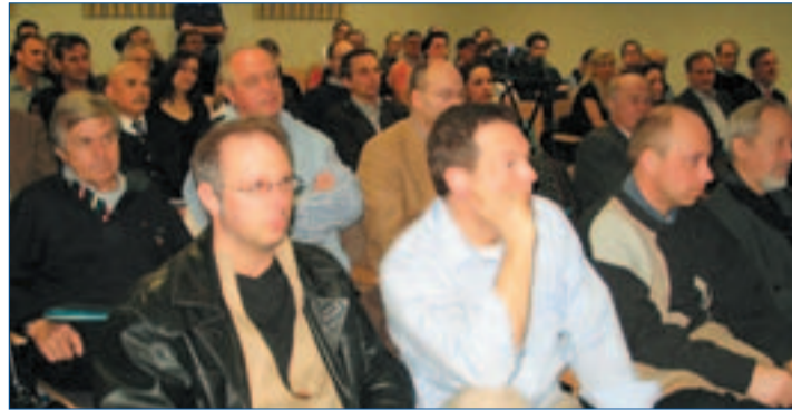
Auf Grund des großen Teilnehmerinteresses gibt es bereits einen zweiten Initialkurs.

spritzungsversuche an Schweineohren und -füßen vorzunehmen. Am Ende der Kursreihe ste-