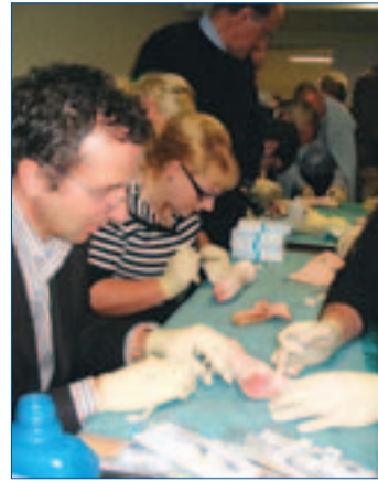
Am Tierpräparat konnten die Teilnehmer ihre Fertigkeiten probieren.