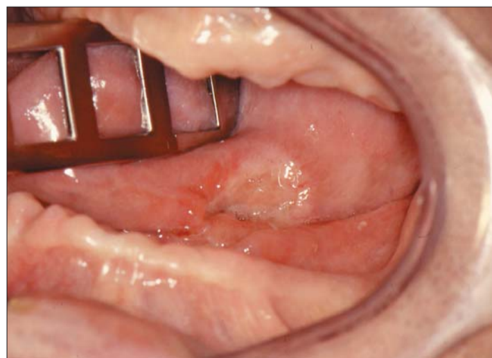
Abb. 1: Mundkarzinom.

her in die zahnärztliche Verantwortung rücken. Auch wird der Zahnarzt künftig zunehmend mit älteren, multimorbiden Menschen konfrontiert und muss ein fundiertes Wissen über allgemeinmedizinische Erkrankungen und Diagnosen, aber auch deren Therapien besitzen. Anders ausgedrückt, der Zahnarzt der Zukunft wird als „Arzt für den Mund-, Kiefer-, Gesichtsbereich“ gefordert sein. Die interdisziplinäre Kooperation von Ärzten und Zahnärzten und anderen Gesundheitsberufen wird deutlich zunehmen. Unschwer ist zu erkennen, dass Oralprophylaxe weit mehr beinhaltet als die Karies-, Gingivitis- und Parodontalprophylaxe. Wie kann das zahnärztliche Team diesen anspruchsvollen neuen Anforderungen gerecht werden?