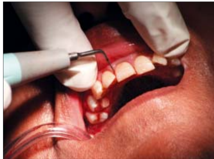
Die Schleimhäute der Mundhöhle bieten die ideale Umgebung für Mikroorganismen. Deren Therapie mit Parovakzinen bildet eine sinnvolle Alternative zur klassischen Behandlung.

Während konventionelle Impfstoffe auf den prophylaktischen Einsatz beschränkt sind, dienen Autovakzine per Definition dem therapeutischen Einsatz bei schon bestehender Infektion.