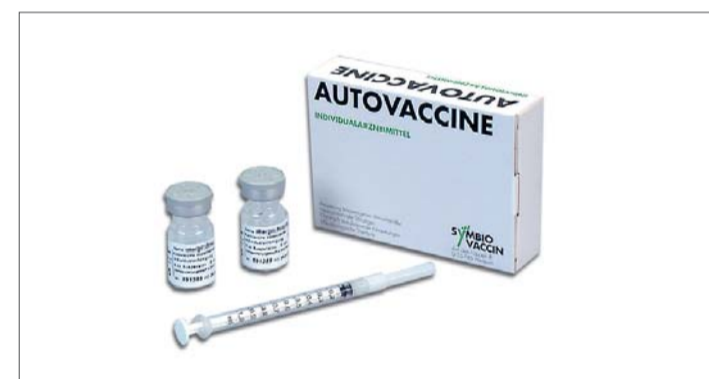
Abb. 3: Autovaccine-Tropfen.

Sie werden dementsprechend als Wachstumsfaktoren bezeichnet. Viele Cytokine spielen außerdem eine wichtige Rolle für immunologische Reaktionen, und sie werden dann allgemein als Mediatoren bezeichnet. Im Wesentlichen gibt es vier Hauptgruppen der Cytokine: Interferone (IF), Interleukine (IL), Koloniestimulierende Faktoren (CSF) und Tumornekrosefaktoren (TNF). Arbeiten deuten nun darauf hin, dass durch eine Aktivierung unspezifischer Effektormechanismen (Makrophagen etc.) durch Autovaccine insbesondere Interferone, Inter-