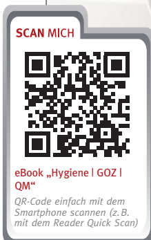
eBook „Hygiene | GOZ | QM“ QR-Code einfach mit dem Smartphone scannen (z.B. mit dem Reader Quick Scan)

ein Internetanschluss und ein aktueller Browser.