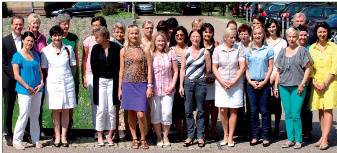
Die Teilnehmerinnen und der Studienleiter der ersten prospektiven Multicenterstudie zur Prophylaxe periimplantärer Erkrankungen während der 18. Jahrestagung der DGDH in Ludwigsburg.

Im Rahmen dieser neuen Multicenterstudie soll die Wirksamkeit der am natürlichen Zahnhalteapparat nachgewiesenen Prophylaxemaßnahmen für die periimplantären Gewebe überprüft werden. „Es gibt weltweit noch keine prospektive Studie, die belegt, dass Prophylaxe eine Periimplantitis verhindern kann. Wahrscheinlich sind einige Konzepte aus der Parodontologie übertragbar – das ist aber bislang nur eine Hypo-