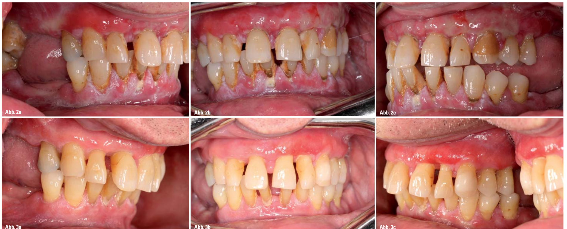
Abb. 2a–c: Therapieresistente Parodontitis und nicht diagnostizierter Diabetes mellitus. – Abb. 3a–c: Nach einer erfolgreichen antiinfektiösen Therapie und eingestelltem Diabetes mellitus.