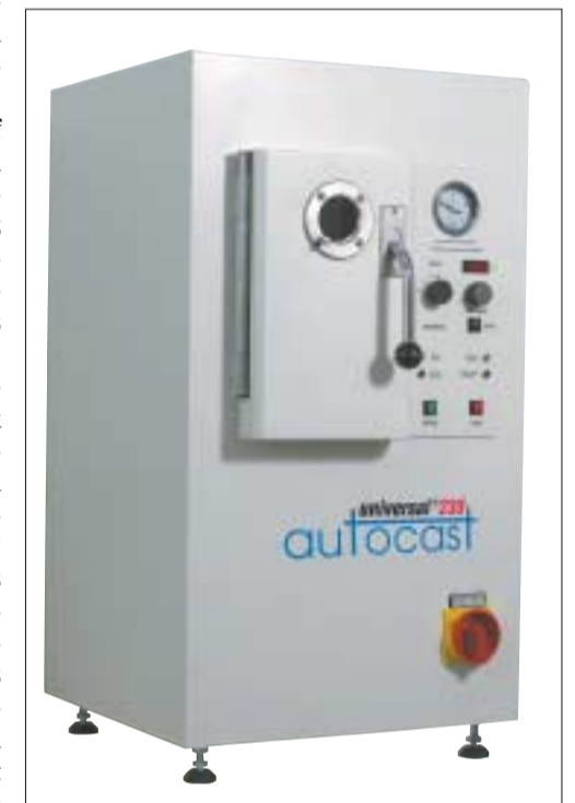
Abb. 8: Universalgießgerät Autocast universal 230 (Dentaurum).

Stand der Verarbeitungstechnologie ist dabei so hoch entwickelt, dass auch die Verarbeitung von edelmetallfreien Legierungen und Reintitan problemlos möglich ist. zt