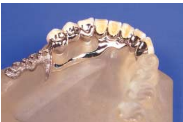
Abb. 4a, b: CoCr-Kombiarbeit mit keramikverblendetem Sekundärgerüst.