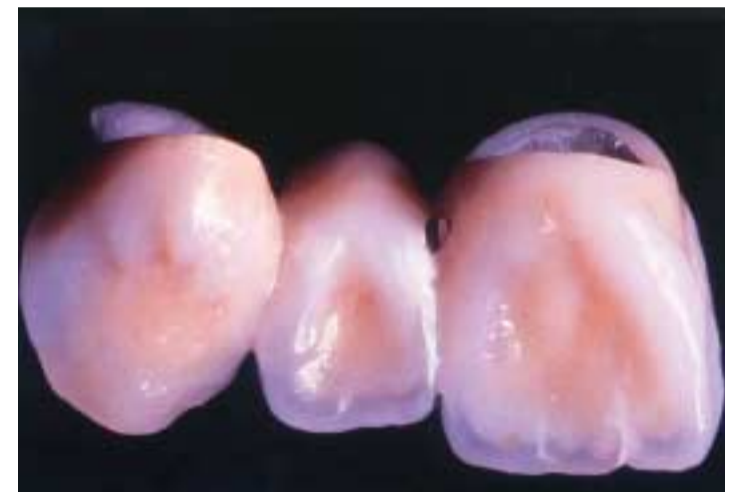
Abb. 3: Ästhetik in CoCr, keramikverblendet.

ständigkeits können heute durch In-vitro-Versuche identifiziert werden. Für diese Testung von Dentallegierungen hat sich weltweit mittlerweile ein siebentägiger Immersionstest in einer Milchsäure-Kochsalz-Lösung etabliert. 4 Dabei zeigt sich, dass heute auch edelmetallfreie Werkstoffe verfügbar sind, die genauso hochkorrosionsbeständig sind wie hochwertige EM-Legierungen (Abb. 5). Die Deutsche Gesellschaft für Zahn-, Mund- und Kieferheil-