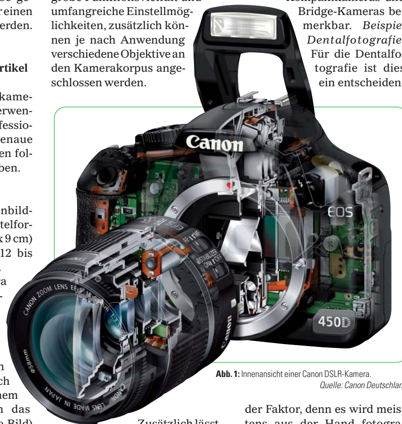
Abb. 1: Innenansicht einer Canon DSLR-Kamera.

ten Flächen) umlenkt, der für den Sucher ein seitenrichtiges und aufrecht stehendes Bild erzeugt. Durch diese Technik ist das Bild im Sucher identisch mit dem Bild auf dem Bildsensor. Erst beim Auslösen wird der Schwenkspiegel hochgeklappt und die Lichtstrahlen können dann auf den Bildsensor fallen. Spiegelreflexkameras besitzen eine große Funktionsvielfalt und umfangreiche Einstellmöglichkeiten, zusätzlich können je nach Anwendung verschiedene Objektive an den Kamerakorpus angeschlossen werden.